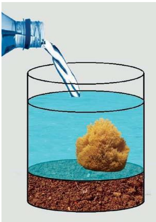
Accumulo idrico: l'estrazione di acqua da un bicchiere o da una spugna richiede un investimento di energia diversamente distribuito nei due casi

substrato, vaschette e feltri di ritenzione compongono sistemi univoci da cui derivano quantità e parametri differenti per ogni caso. Per concludere possiamo affermare che un buon sistema a verde pensile in clima mediterraneo deve avere molta acqua disponibile ATD e un indicatore di efficienza EF vicino a 0,5 o superiore.